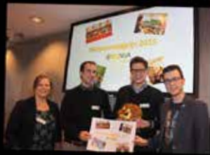
Jong N-VA Gent