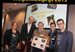
Jong N-VA Zuidrand