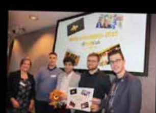
Jong N-VA Tongeren